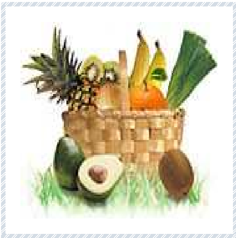
fruits et légumes